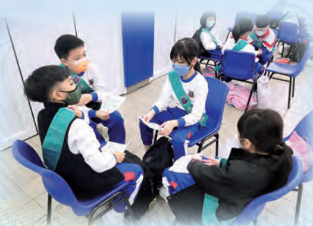
同學互相討論：怎樣做一個好風紀？