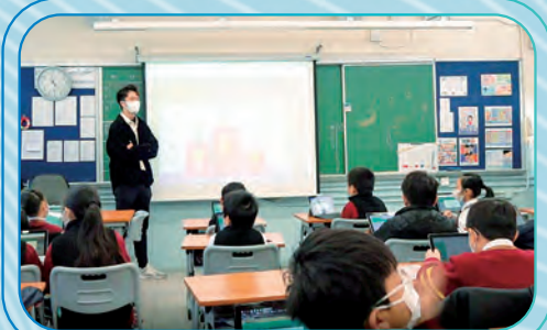
學生能從多元化的學習模式中提升自學能力。