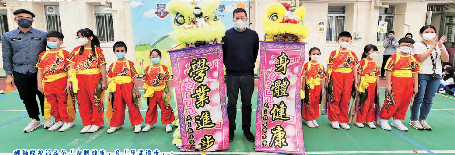
醒獅隊祝福各位「身體健康」及「學業進步」。