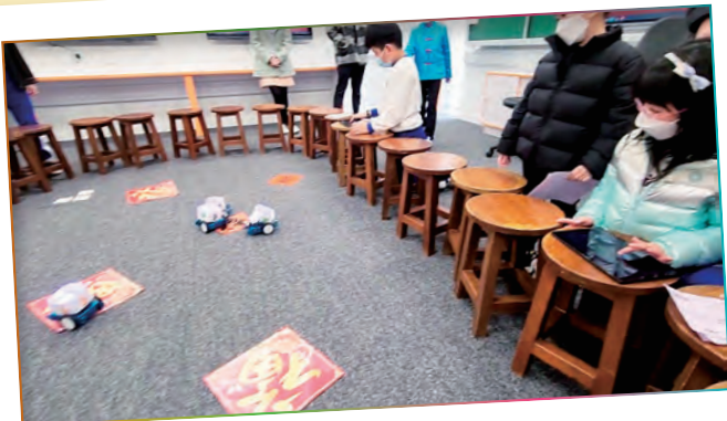
高年級學生利用電子學習裝置編寫一套程式指令，令機械車可以用控制器操作，亦可跟隨路線移動。