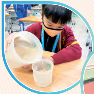
學生嘗試利用量杯量度器皿的容量。

數學科除了學習數學的基礎概念和計算技巧外，亦著重發展學生的思維能力及解難能力。透過不同的實作活動，讓學生建構數學知識，亦會在日常的教學中滲入解難元素，以培養學生成為一個愛思考、懂解難的「數學人」。