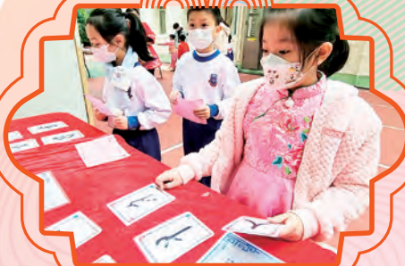
同學正在進行「象形文字對對碰」活動。