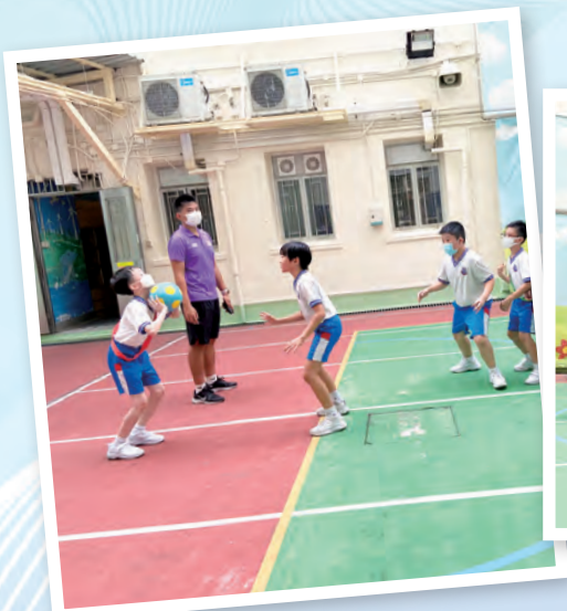
同學積極參與合球訓練，正進行練習賽。

學校引入新興運動，舉辦男女混合的球類隊際運動——合球。合球起源於荷蘭，主張兩性平等，男子和女子都有平等的機會和條件去參加合球，促進男女共同學習和合作。