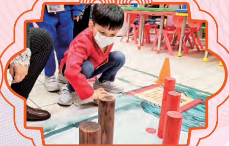
同學嘗試以木射方式來碰擊紅樽。