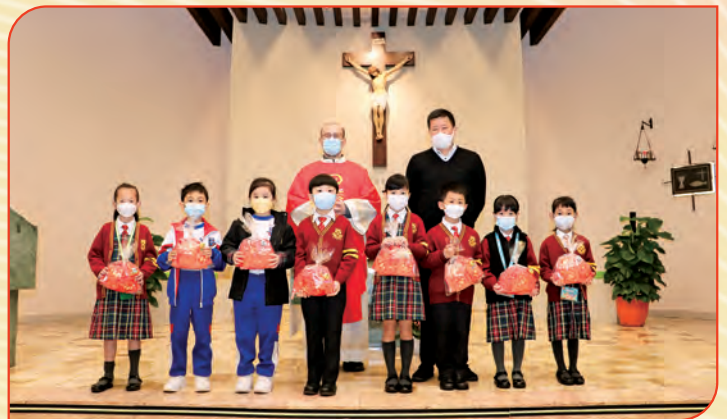
2月1日進行新春祈禱會，各班代表接受學校的祝福。

本校一至三年級全級學生為基督小先鋒成員，而四至六年級亦有基督小先鋒核心小組，此外還定期舉辦公教生聚會，讓學生透過參與多元化的宗教活動及服務，認識天主教的信仰及福音的精神，培養正面的價值觀，並效法聖母「仁愛、忍耐」的芳表，在生活中活出基督。