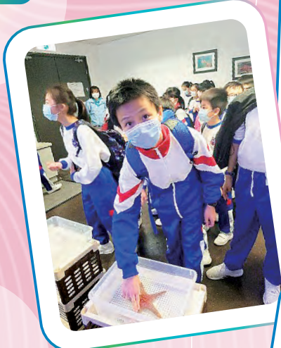
五年級參觀海洋公園

應用科學與科技可以解決日常生活的問題，並提升學生對基本科學探究過程的技能。在常識課堂，各年級進行 STEM 及科學探究活動。