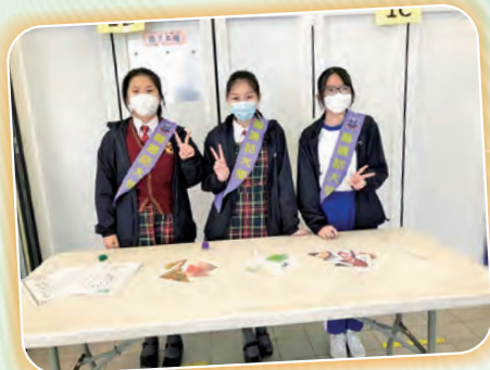
普通話大使主持攤位遊戲。