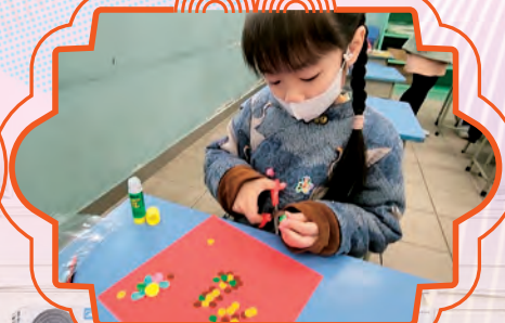
同學用心設計賀年飾物。