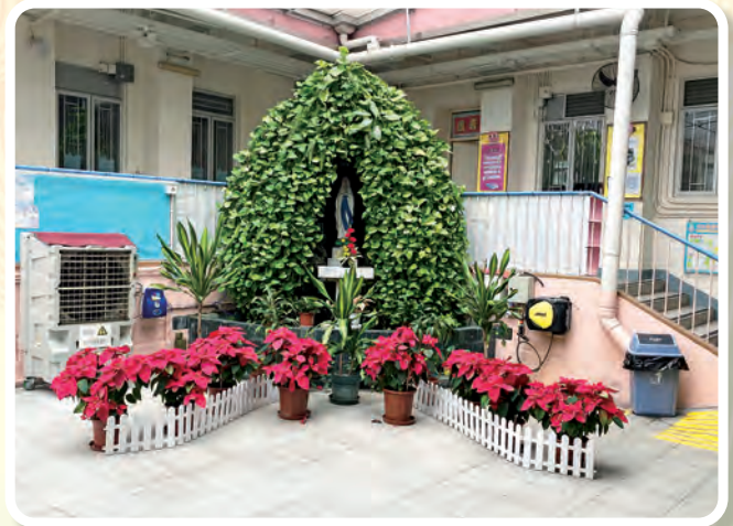
小息時，同學會到天井的聖母山祈禱，享受與天主親近的時間。