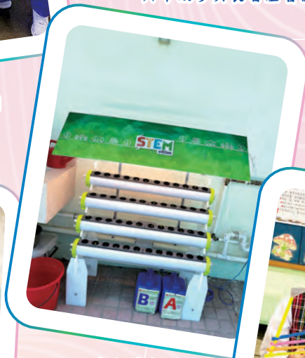
四年級進行「水耕課程」