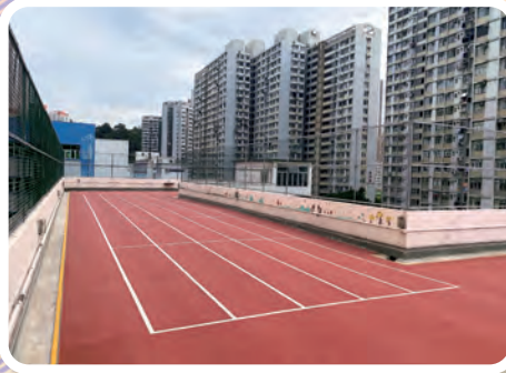
設有天台操場，為學生創造活動空間。