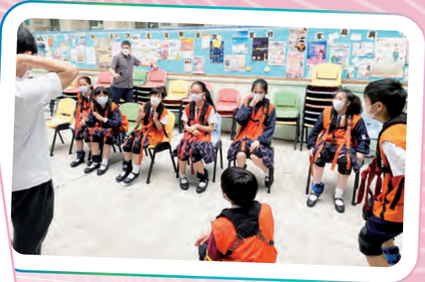
六年級參與長者歷耆體驗工作坊