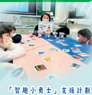
「智趣小勇士」支援計劃