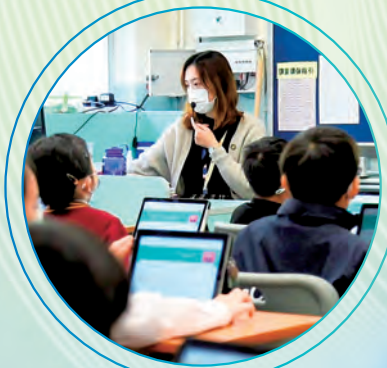
每位同學都有機會回答老師的問題。