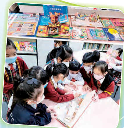
主題閱讀書展，讓學生感受書中的趣味，大家看得多投入！