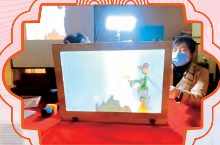
同學們正在欣賞《孫悟空修補天宮》皮影戲互動劇場。