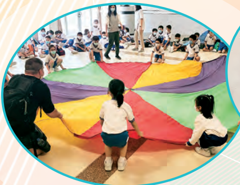
師生同樂 · 一齊起動