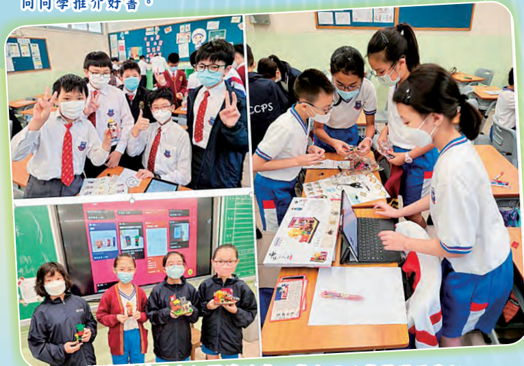
圖書課透過小組閱讀活動，學生可以學習運用資訊科技自主學習，更可以明白與人分工合作的重要。