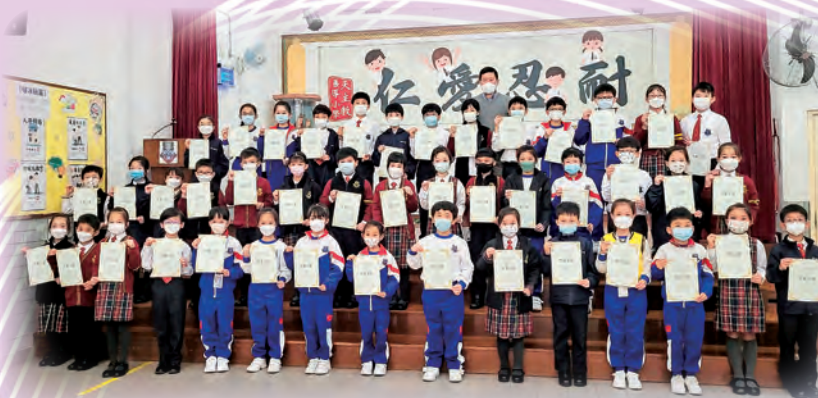
為了表揚在「尊重」方面表現優異之學生而設立的「友愛之星」選舉

學校校風淳樸，以「仁愛忍耐」為校訓，訓輔合一。今年本校以「尊重」為主題，透過早會分享、校本活動、小組訓練及跨學科活動等，培養善導學生應有的特質——尊重，從而培養學生以禮待人，互諒互讓，做個禮貌的善導人。此外，學校會培育學生以愛主愛人之心善待他人，彼此關懷和互相尊重，建立和諧校園。