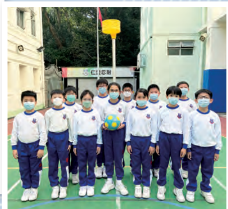
由男生和女生所組成的合球隊。