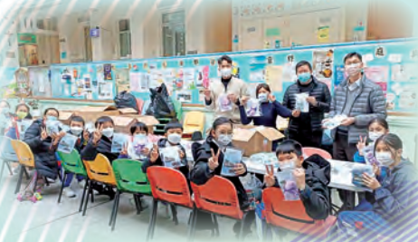
義工「送暖行動」：公益少年團的團員協助包裝禮物。在聖誕期間，堂區聖堂把禮物包裝送往明愛醫院的院友，為他們送上關懷和祝福。