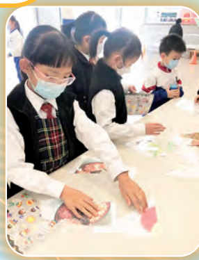
同學們開心地砌拼圖，迎接新年。