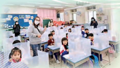
家長義工到課室協助低年級學生進行午膳。