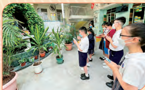
同學能體察近人的需要，為家人、朋友及社會誦唸玫瑰經。