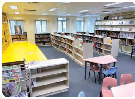
圖書館藏有大量圖書，同學們可沉醉於書海之中。