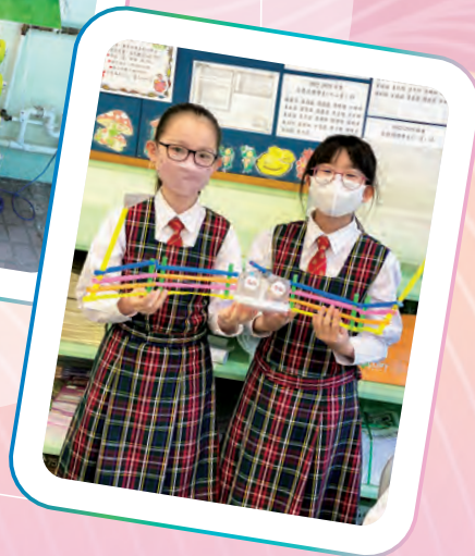
五年級設計環保收集船