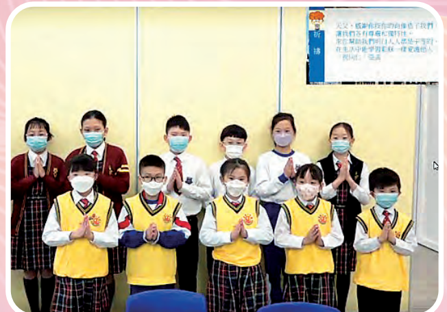
周會後透過實踐「尊重」的小任務，培養學生重人自重的品格。