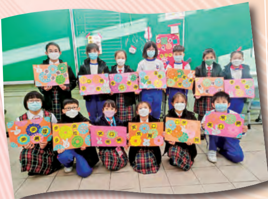
視藝培訓小組學員在導師的帶領下，將中國文化揉合現代藝術創作形式，一同製作新年剪紙拼貼畫。

學生通過校本視藝課程學習相關藝術知識與技能，從中培養藝術方面的敏銳觸覺和評賞能力，並積極鼓勵同學參與各項繪畫比賽。本科亦設有視藝培訓小組，讓對藝術有興趣的學生發揮潛能，學習更多的創作技巧，共同美化校園。