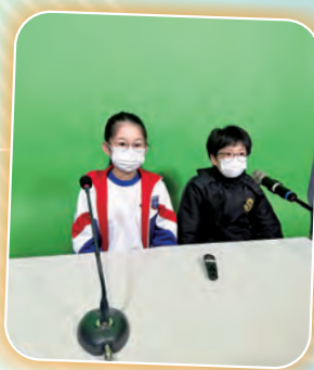
早會上，同學用普通話介紹新年習俗。