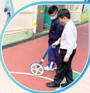
學生於操場利用滾輪進行量度活動。