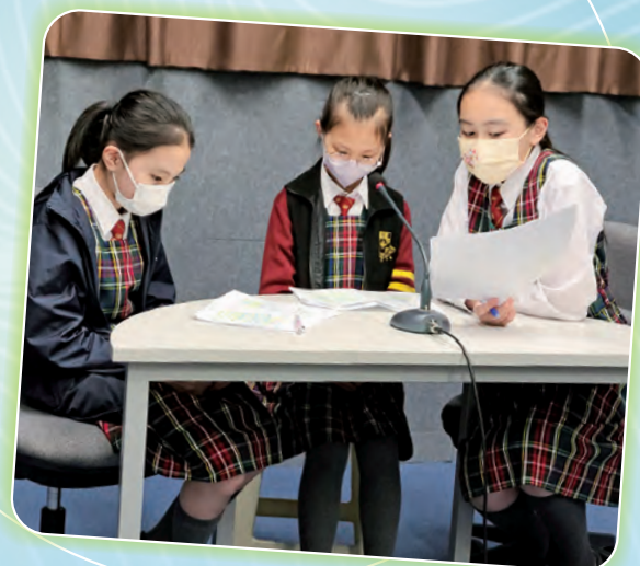
圖書館管理員為書本錄製廣播劇，大家都非常認真投入呢！