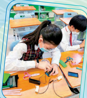
同學開始為濾水裝置編寫程式。