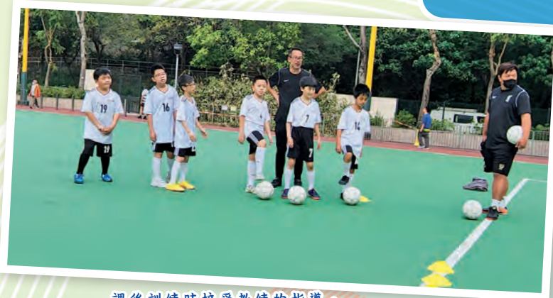
課後訓練時接受教練的指導。

男子足球校隊於本學年終於可以照常訓練了！隊員在受訓期間接受教練之專業指導，從而提升足球技術水平。男子足球校隊早前參加了九龍西區學界足球比賽，各隊員全力以赴並晉級十六強；在獲得寶貴的比賽經驗的同時，並從比賽中學懂尊重對手及球證之重要。