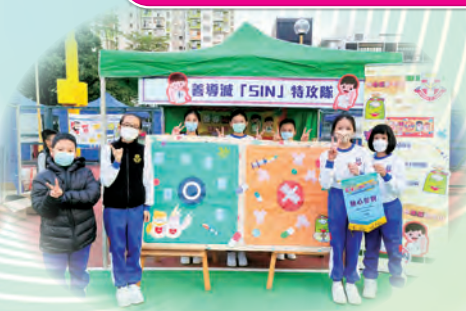
公益少年團的團員參加了深水埗減罪嘉年華會，宣揚禁毒減罪信息。