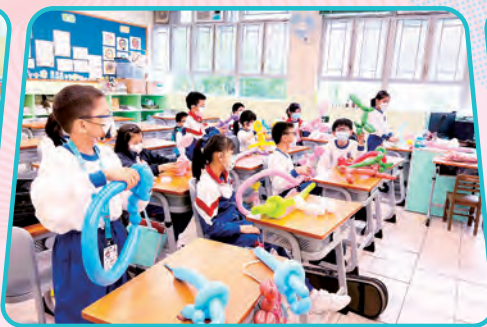
扭汽球 · 冇難度