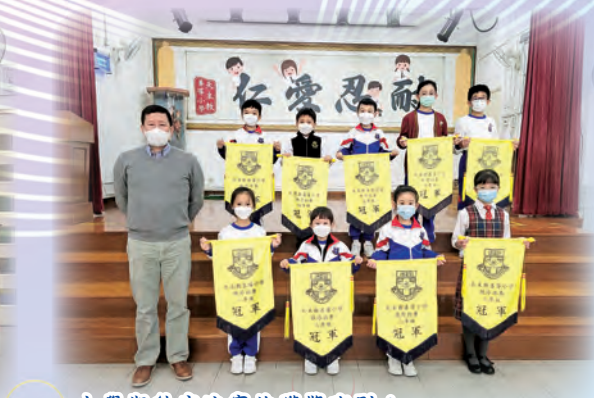
上學期秩序比賽的獲獎班別： 1C、2A、3C、4A、4B、5A、6A、6D