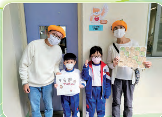
圖書科誠邀長者義工到校與初小學生共讀繪本，同學更親手寫上感謝卡送贈長者義工。