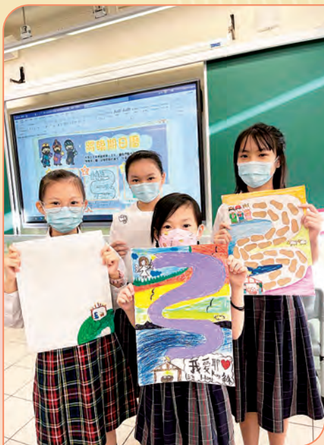
同學利用環保紙製作將臨期日曆，提醒自己要好好準備心靈，迎接小耶穌誕生。