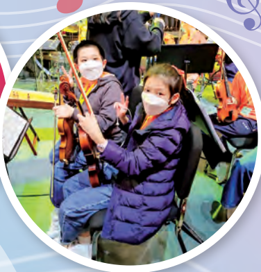
表演學生與其他學生一起綵排