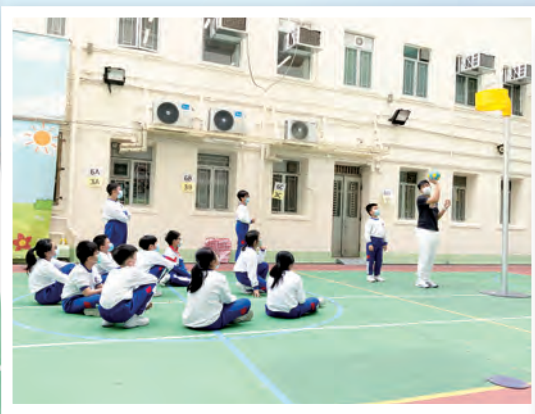
學生專心上課，聽從教練教導。