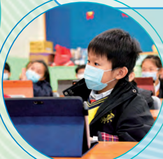
同學們全神貫注地聽老師的講解。