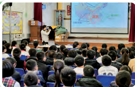
中國不同的地區各有獨特的飲食文化，因此大家應互相尊重、彼此欣賞各地方不同的飲食文化。