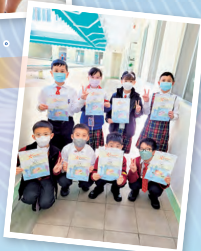
同學對 sportACT 計劃都十分支持。

為了鼓勵學生恆常做運動，本科亦會注重學生課堂外的生活習慣，所以每年暑假都會參加由康文署主辦的 sportACT 獎勵計劃。今年亦不例外，全校共有 580 名學生參加，126 人得金獎、84 人得銀獎和 46 人得銅獎。希望學生鍛鍊好體魄，迎接新學年。