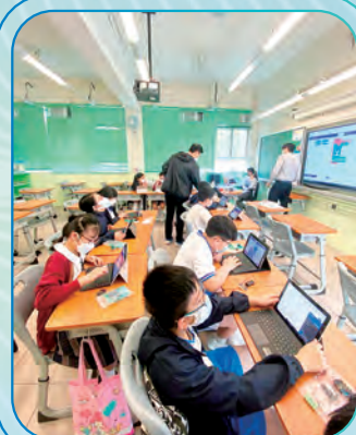
同學透過 Micro:bit 學習 AI 人工智能背後的原理。