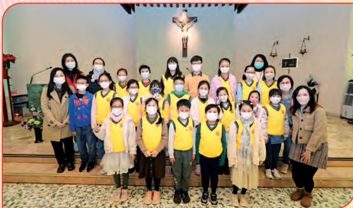
12月20日聖誕祈禱會，基督小先鋒負責領唱。