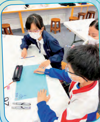
同學正在探究海洋的污染問題。