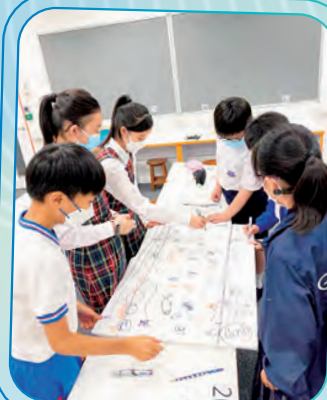
同學在討論如何解決河道上的垃圾。