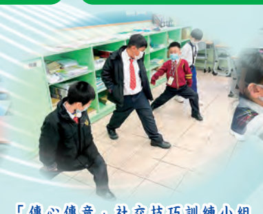
「傳心傳意」社交技巧訓練小組