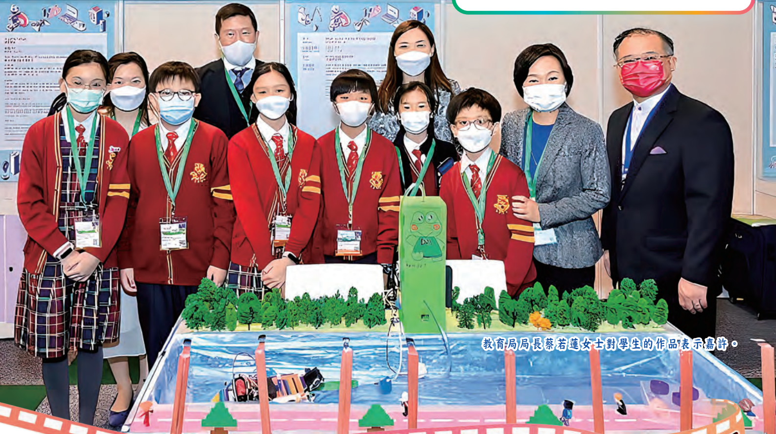
教育局局長蔡若蓮女士對學生的作品表示嘉許。

本校於12月7日出席「學與教博覽2022」，以展示由 Ocean STEM 小組所負責的河道淨潔系統，當中運用了 AI 人工智能與 Micro:bit 程式來協助清理河道的垃圾和淨化河水。教育局局長蔡若蓮女士更特意前來探望，對學生作品表示肯定之餘更勉勵大家要繼續努力。