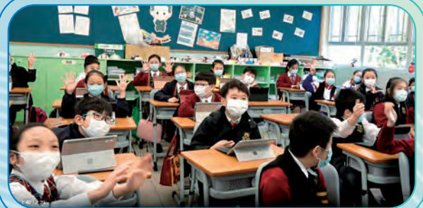
學生回答問題後，老師能即時給予學生回饋及跟進。