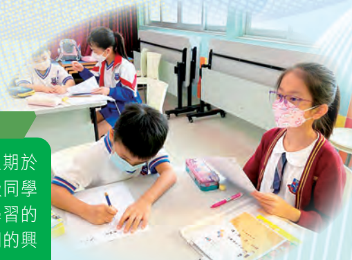
小老師正和小一同學進行伴讀活動。

高年級的小老師接受訓練後，每星期於小息及導修課時段，為有需要的低年級同學進行「讀、默、寫」的訓練和多感官學習的遊戲，從而引發同學對中文及英文字詞的興趣，使他們能更有效地在課堂內學習。