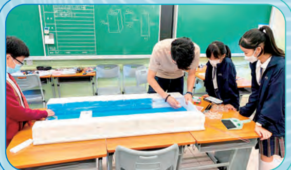
同學製作河道模型來進行試驗。

本年度，Ocean STEM 小組繼續以「保護海洋」為主題，以「學習、思考、想像、創造」等四個階段，學生透過 Micro:bit 學習 AI 人工智能背後的原理，並結合 AI 視覺模塊與其他感應器，製作視像辨識智能裝置及濾水裝置來解決海洋污染問題。