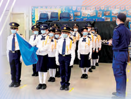
升旗隊隊員接受正規的升旗訓練