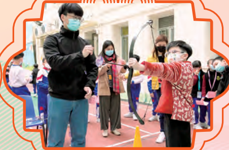
同學體驗古代射箭活動。