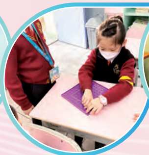
學生利用釘板圍出不同的平面圖形。