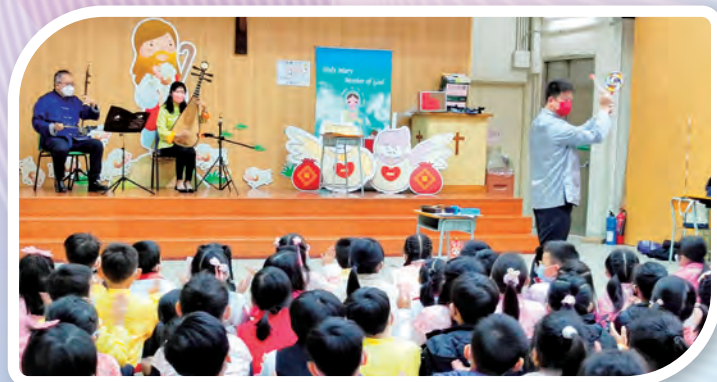
導師示範二胡、琵琶、中國敲擊樂器

於 1 月 20 日進行，邀請 Innex D&B Limited 到校為全校小一至小六學生舉行中樂音樂會，包括樂器介紹 (二胡、琵琶、中國敲擊)，演奏新年樂曲恭喜恭喜、鳳陽花鼓等。