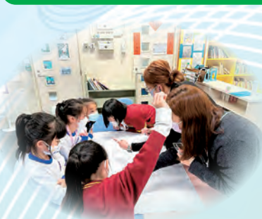
「童心共融愛同行」小組