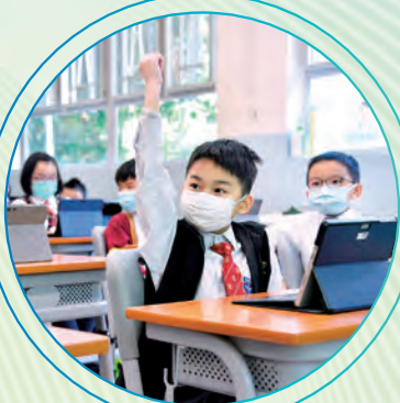
電子學習提升了學生的學習興趣。

本校於四至六年級選定中文、英文、數學及常識為重點發展科目，透過學生自攜裝置的機遇，安排以資訊科技為核心的學習活動，發展校本電子學習課程，發揮資訊科技學習的優點，提升學習效能。學生能利用電子學習達致延伸學習、網上討論、合作學習等多元化的學習模式。老師亦能按學生需要，設計適切的學習活動、照顧學生的學習差異，以及不同的學習模式。此外，老師能以電子學習的優點，收集評估數據以優化教與學的成效。