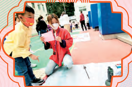
同學盡力地把竹枝投向壺中。