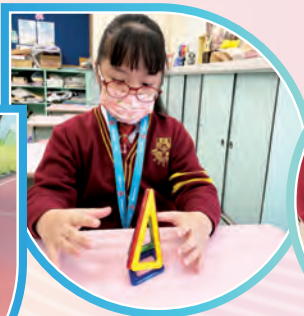
學生正拼砌不同的立體圖形。