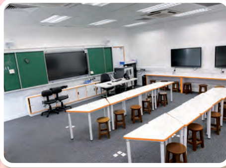
新的 STEM ROOM 已經啟用