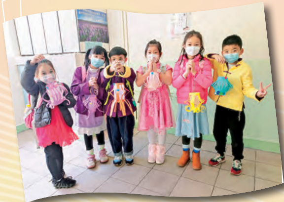
二年級同學在「中國文化日」製作別緻的中式花燈，美化家居。