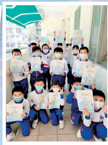
得獎同學齊來合照。