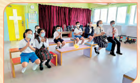
公教同學透過祈禱聚會，認識煉靈月的意義，為煉靈祈禱，並反思自己的失誤與不足之處，希望能努力做好，成聖自己，聖化他人。