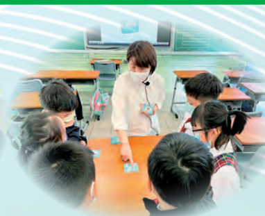
「專注小精靈」執行功能訓練小組