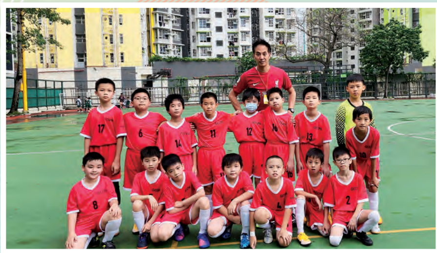
2022 至 2023 年度男子足球校隊。