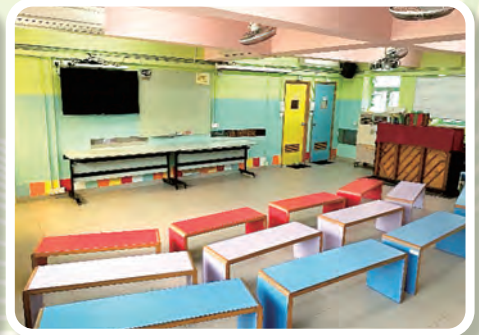
學校設有音樂室，悅耳的歌聲與琴聲傳遍整個校園。