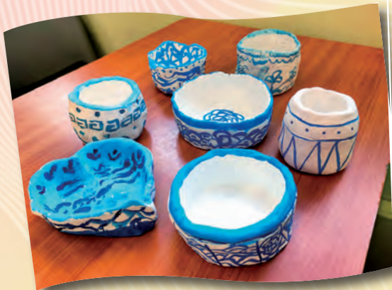
六年級同學仿做青花瓷的作品風格，以「喝茶文化」為主題創作茶具。