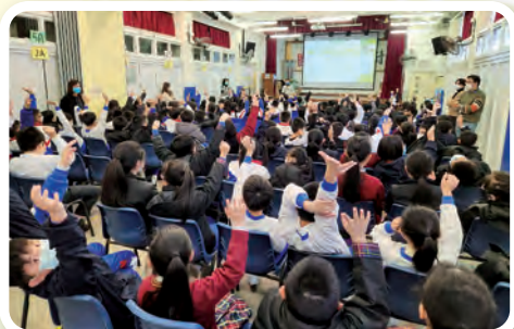
同學們對這講題非常有興趣，不但用心聆聽，更踴躍回答提問。