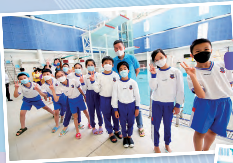
上下齊心，校長和學生抵達游泳池後隨即合照。