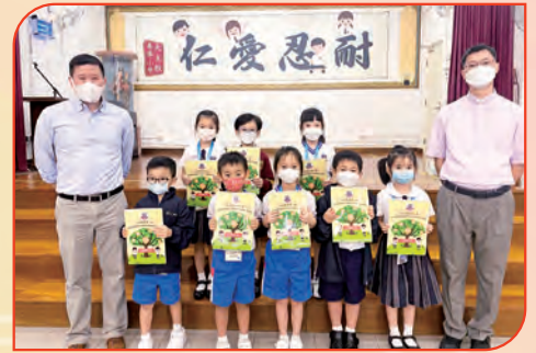
9月30日進行小一滿月，感謝天主的眷顧及慶祝小一同學加入善導小學這個大家庭。