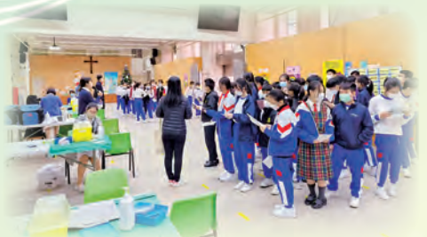
按衛生署指引為學生安排防疫注射，以及接種季節性流感疫苗。