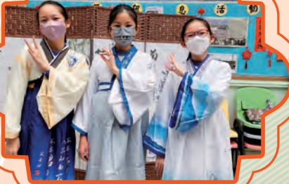
同學們試穿古代傳統華服。

本校於1月20日舉行了中國文化日，當天更邀請了本區的幼稚園學生到校參加中國文化嘉年華活動，當中安排了投壺、射箭、木射、鐵滾環、沙包、踢毽子、彈弓及空竹等攤位遊戲供學生從玩樂中認識中國古代的民間遊戲。而學校更設有華服試穿的體驗活動，讓學生從中認識中國在不同朝代的服裝上各有不同。除此之外，學校更為學生舉辦了《孫悟空修補天宮》專題互動皮影戲、《花木蘭代父從軍》互動戲劇表演、「語文基金：語文特工隊——毛筆奇俠」、中樂欣賞及醒獅表演，並讓學生體驗以利是封來設計立體新年吊飾及花燈，引發學生學習中華文化之興趣，建構學生對中華文化認知的根基。