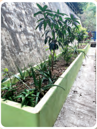
位於後座禮堂後方的種植區，讓學生、家長及老師一同享受園藝活動的樂趣。