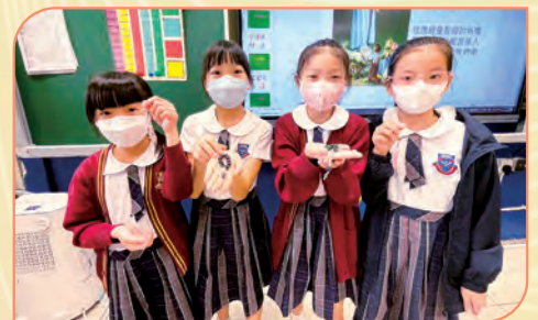
同學的製成品將會送給家人及自己誦唸《玫瑰經》之用。