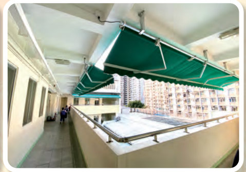
前座增設了電動帳篷，學生以後不會被雨水弄濕了。