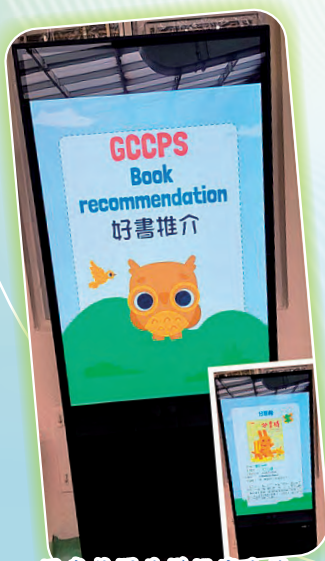
圖書館門外增設廣告機，向同學推介好書。

疫情漸趨平穩，圖書館終於可以開放讓同學閱讀了。圖書科透過多元化的閱讀活動，積極推廣校內閱讀風氣及同學自主學習的能力；期望將來學生能繼續從茫茫書海中發掘寶藏，享受閱讀的樂趣。