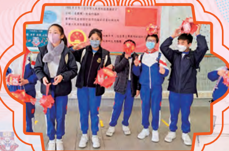
同學們學會以利是封來設計立體新年吊飾及花燈。