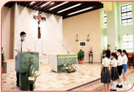
9月7日進行開學祈禱會，由學生代表說出本年度的學習承諾。

本校與聖老楞佐堂相連，得到堂區的支援，常在聖堂內舉行宗教活動。而且學生經常接觸神父，透過祈禱會及各項宗教活動，培養正面的價值觀，感受天主的愛，學習耶穌的訓誨，同時接受聖言的滋潤。