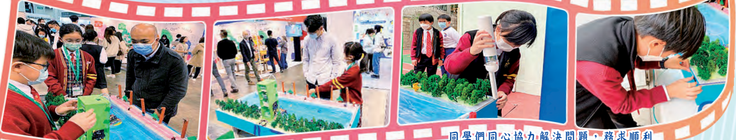
同學們向會場內的人士展示及介紹自己的學習成果。