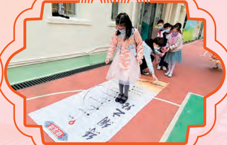
同學以鐵杆努力地控制鐵環滾動。