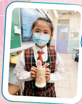
二年級學生自製玩具