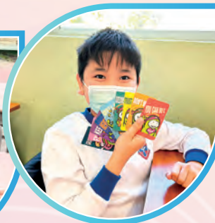
學生堅毅地完成所有速算練習，終於集齊全套「堅堅卡」。