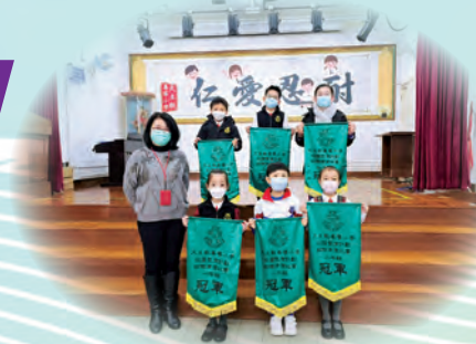
「校園清潔比賽」：培養學生保持課室整潔的習慣，愛護校園，做個善導好管家。