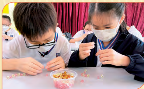
基督小先鋒認真學習串唸珠。