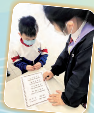
同學們正專心地誦讀古詩文。