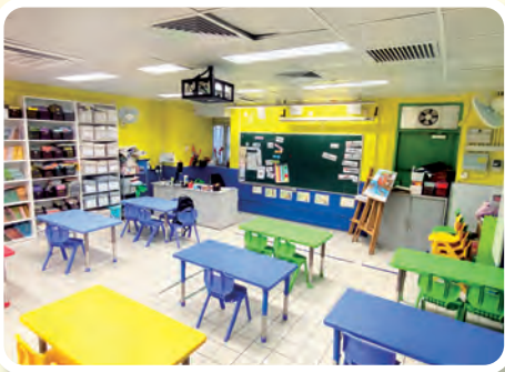
英語為母語的外籍老師會利用這園地提升同學的英語水平。