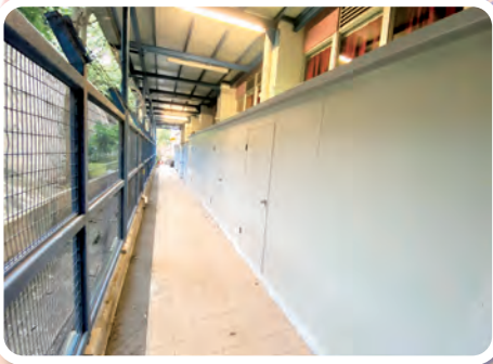
後座增設大型存物櫃，能提供更多的活動空間。