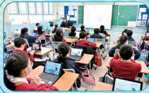
同學們從學習的過程中了解到自己的學習狀況。